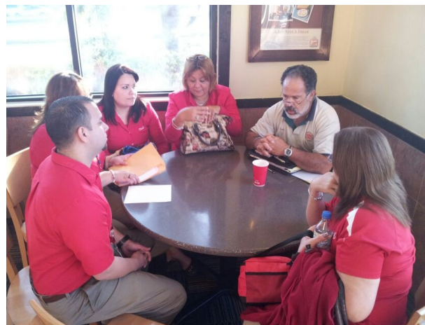
Juramentación Delegados (as) y Delegados (as) Alternos (as) del área oeste.

Nuestras felicitaciones a los nuevos delegado(a)s y delegado(a)s alterno(a)s por su compromiso con sus compañeros de trabajo y con nuestra HERMANDAD. Recuerden que el Comité Ejecutivo y el Consejo de Delegados en pleno están a su total disposición para asistirles en su nueva encomienda.